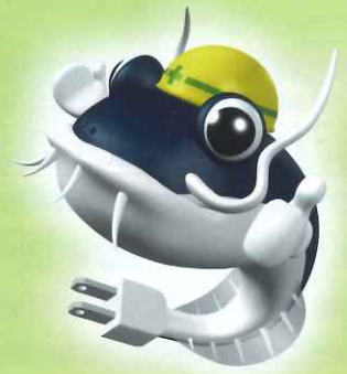
電気ナマズの「電なま君」